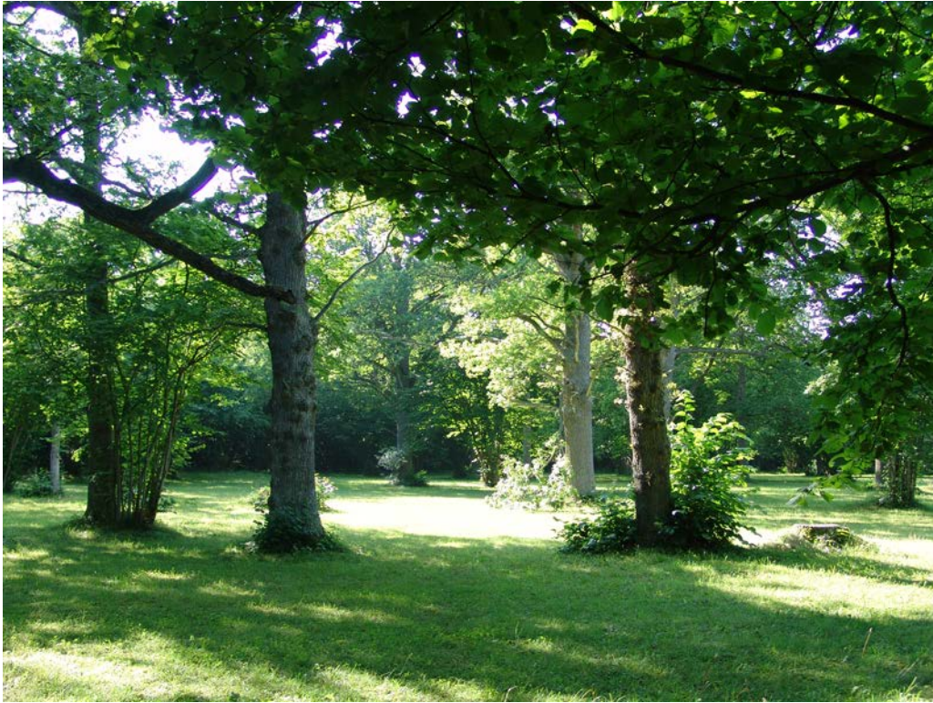
Figur 3. Fide prästänge i Gotlands artrikaste område. Lövkronor och hasselbuskage i lagom halvöppen del av ängset ger bra betingelser för många fladdermusarter. De kan ha kolonier i hålträd i ängset eller i den täta skogen intill.

Bilder från gotlandsmiljöer och kommentarer med avseende på fladdermöss