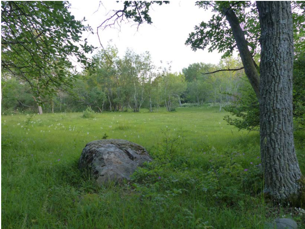
Figur 11. Hässleänget. Bryn vid glänta med översilningskärr.