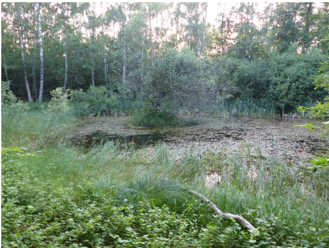
Figur 9. Klosteränge med ett före detta viltvatten där mängder av fladdermöss dricker vatten innan de ger sig av för att leta insekter.