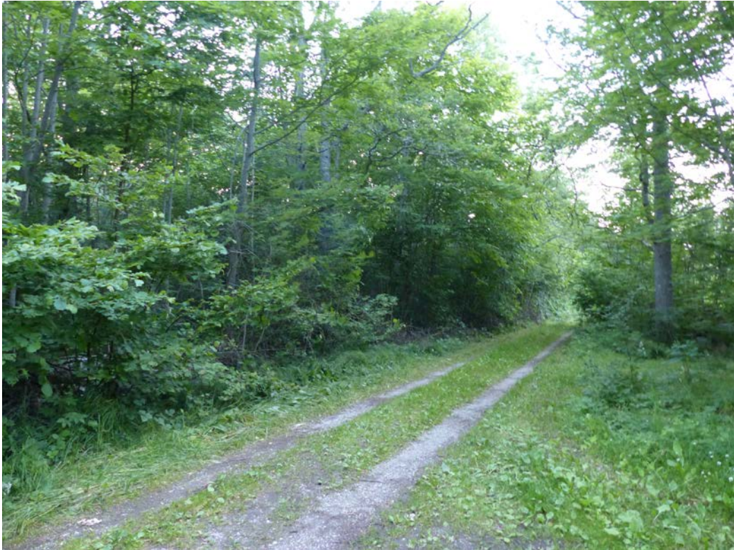
Figur 7. Pankar i naturskogsdelen med markväg och utfarter till små odlingar. Miljön används ofta av fladdermöss som trasportleder men också för insektjakt.