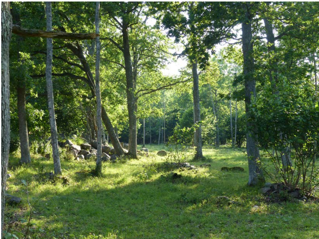
Figur 12. Salmbärshagen (Ekebysänget) med gamla ekar. Fårbetet har slitit hårt på buskskiktet. Det kan leda till minskat antal fladdermusarter och den insektproduktion de är beroende av.