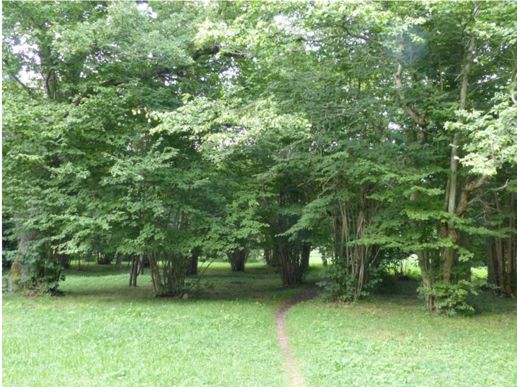
Figur 5. Öja i del av hävdat änge med täta hasselbuskar och överståndare av lövträd. En biotop med områdets största aktivitet av ett flertal fladdermusarter.