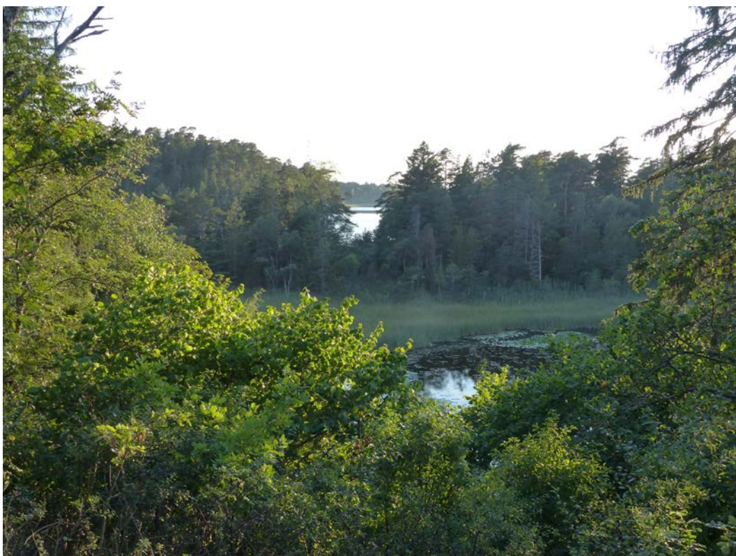
Figur 10. Lojsta slott med utsikt från högsta punkten. Ett landskap med småsjöar, branter, gammal barrskog, lövskog, sumpskog och naturbetesmarker.