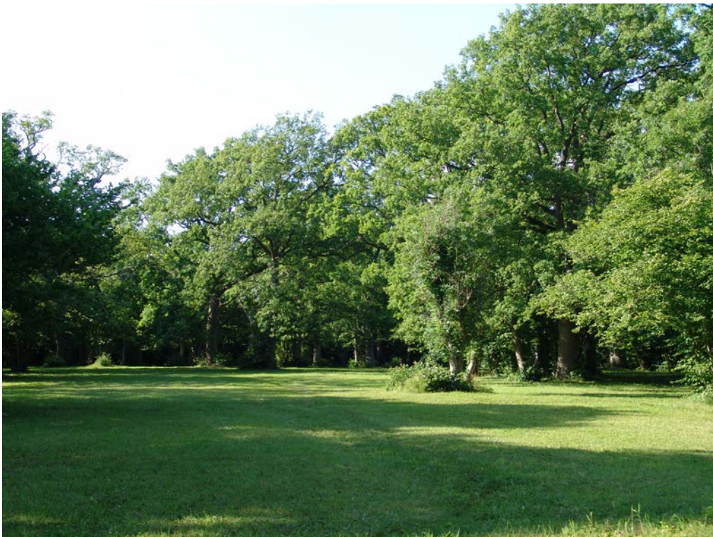
Figur 4. Fide prästänge med en öppen del. Om beskärning av hassel och fällning av träd ger alltför stora öppningar kan några dominantas arters förekomst öka med risk för artförluster i fladdermusfaunan.