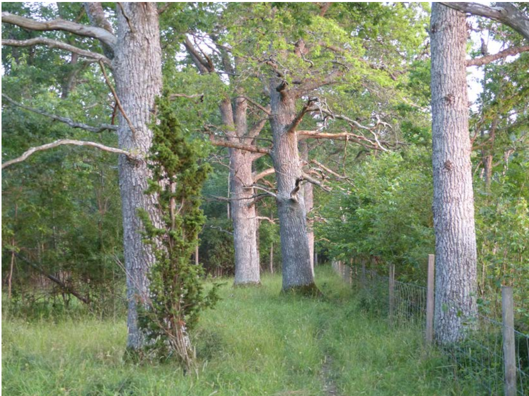
Figur 8. Klosteränge med gamla ekar. Äldre lövträd är viktiga att bevara för flera arters kolonier i håligheter, till exempel ihålig stam, hackpetthål, lös bark och blixtskador. Kring och över lövkronorna finns ofta insekter som fladdermössen jagar.