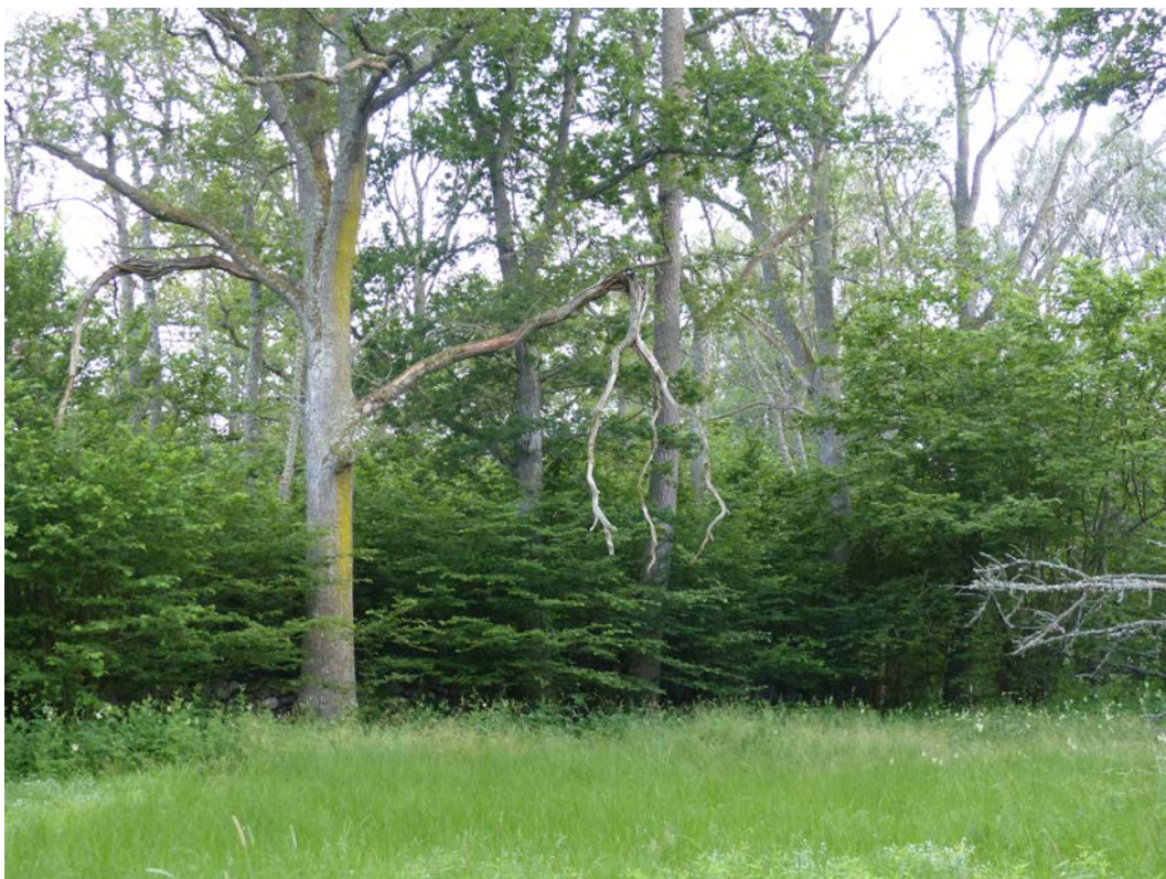
Figur 6. Pankar med Grötlingbo prästänge vid övergången från hävdat änge till den igenväxande täta naturskogsdelen. Kombinationen av de två naturtyperna ger idag förutsättningar för flera arter som knappast kan förekomma i renodlade ängen.